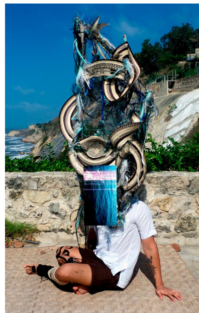
Guadalupe Maravilla El Fantastico, 2010

Tocado/pieza usada en la cabeza : Una cubierta ornamental o banda para la cabeza especialmente una que se usa en ocasiones ceremoniales.